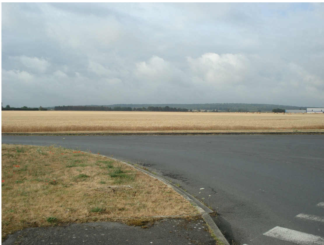
2 - Vue du terrain dans son état actuel depuis l'avenue du Parc Alata au Nord-Est de la parcelle, en direction du Sud-Ouest.