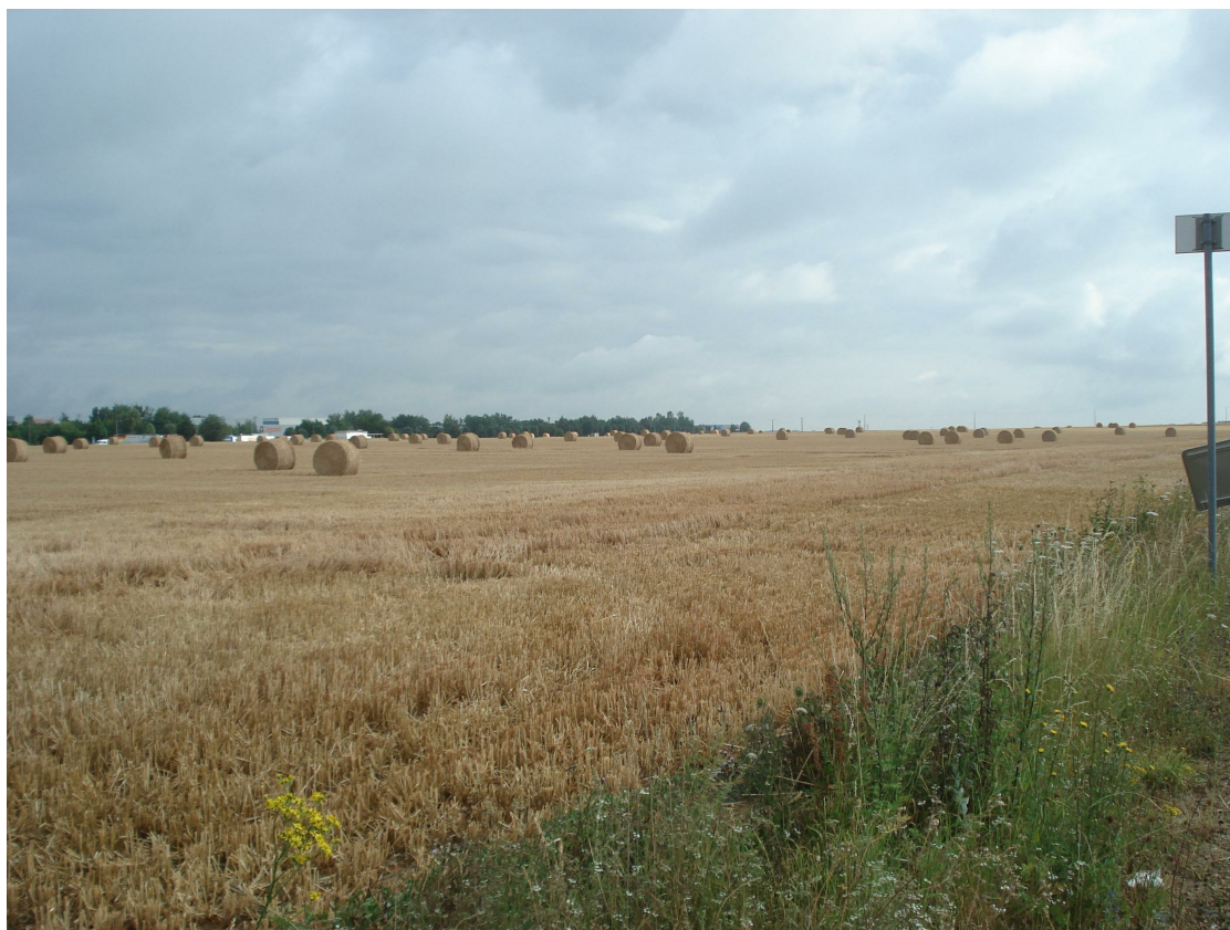
4 - Vue du terrain dans son état actuel depuis l'avenue de la Forêt d'Halatte au Sud-Ouest de la parcelle, en direction du Nord-Est.

DEMANDEUR : 64, av. du Maréchal Joffre 60500 Chantilly GAMMALOG