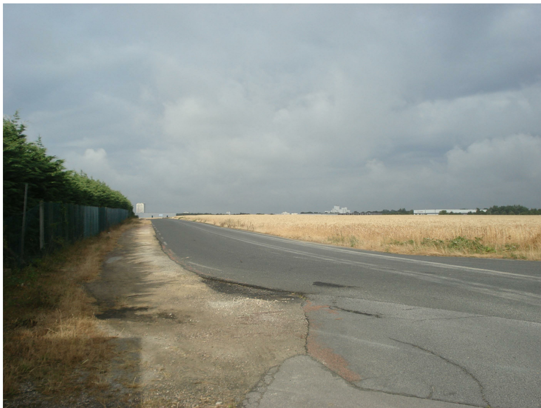
3 - Vue du terrain dans son état actuel depuis l'avenue de la Forêt d'Halatte au Nord-Est de la parcelle, en direction du Sud-Ouest.

Nota: Repérage des points de vue des prises photographiques indiqué au plan PC1 - Plan de situation