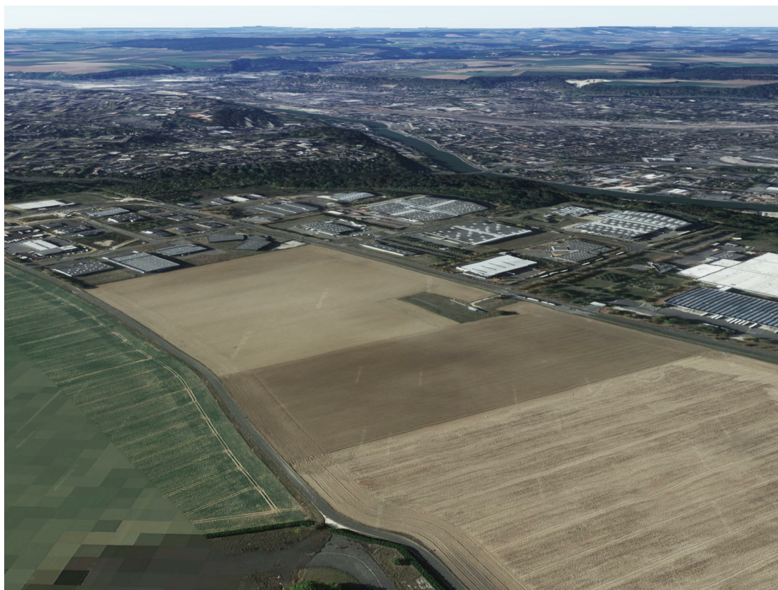
1 - Vue aérienne du terrain dans son état actuel depuis le Nord-Est de la parcelle, en direction du Sud-Ouest.

Nota: Repérage des points de vue des prises photographiques indiqué au plan PC1 - Plan de situation